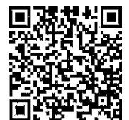
申込用二次元コード

右の二次元バーコードを、スマートフォン又はタブレットで読み込み、申込専用の Google フォームより必要事項を記入してお申込みください。